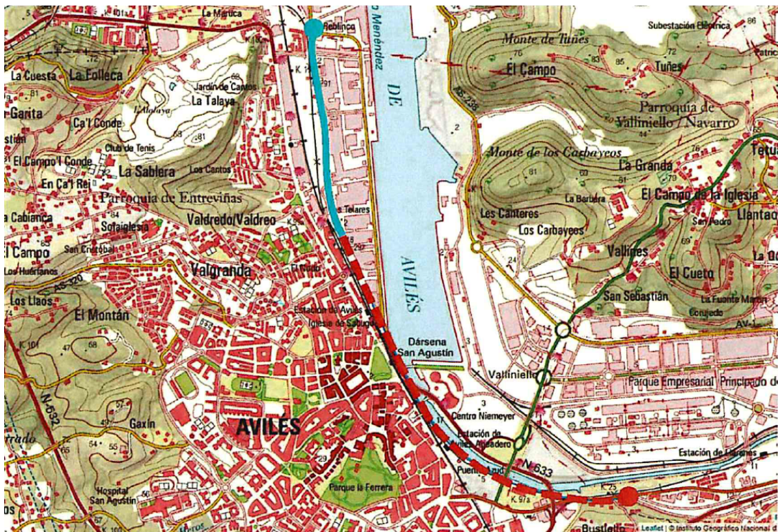
Esquema gráfico de la propuesta. (Incluido en el escrito – moción).

Abierto el debate sobre este asunto, se producen las siguientes intervenciones: