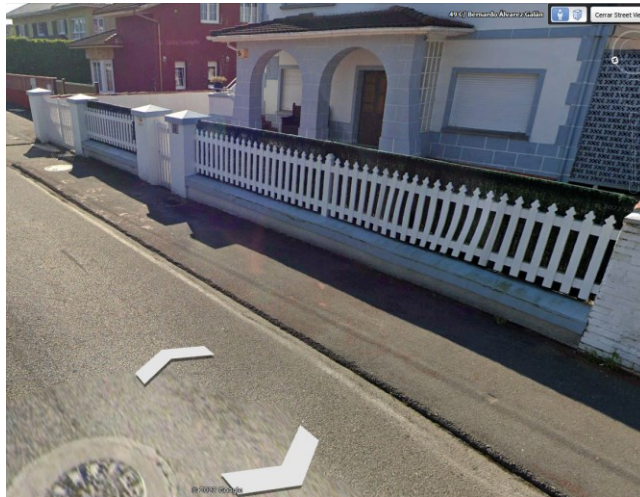
Imagen del frente de la vivienda del Google Earth

La primera: en la retirada de la pavimentación exterior existente. También se tendrá que procederá a la tramitación de la reforma de cada uno de los servicios de los que cuenta la vivienda (gas, electricidad, agua, saneamiento, ...).