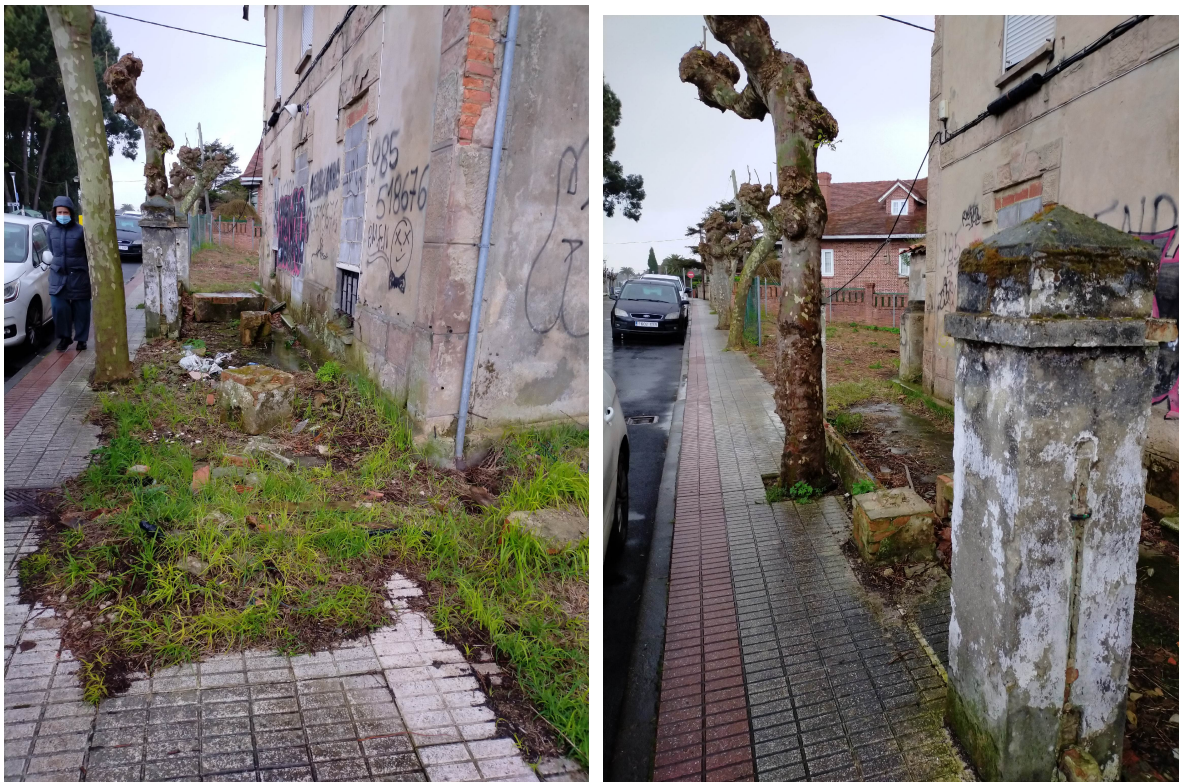
Tramo de acera en el frente de la vivienda de la C/ Bernardo Álvarez Galán nº 42

Girada visita a la zona se observa: existe un frente de aproximadamente 30 m de longitud, con un ancho variable entre 1 m y 1,7 m, que actualmente se encuentra con cierre y que invade parte de la acera existente, en ese tramo en concreto de la calle Bernardo Álvarez Galán, a la altura del nº 42.